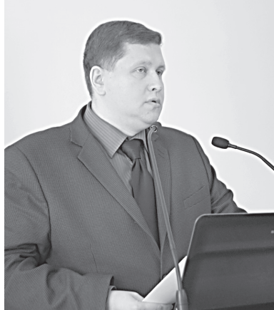
Например, главным вопросом

– Ранее руководящий аппарат Университета организовывал подобные встречи по мере накопления вопросов – весной 2013 года и осенью 2014 года, хотя в дальнейшем мы планируем проводить их регулярно – раз в семестр. Цель совещаний – донести до деканов и заведующих кафедрами ряд важных, актуальных для развития Университета тем, которые должны решаться при активном содействии возглавляемых ими подразделе-