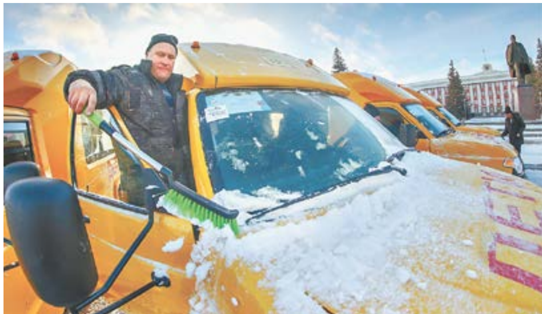
В регионе учеников обслуживают свыше 500 автобусов.

За весь 2023 год 14 автобусов куплено за счет краевого бюджета и 49 автобусов за счет федерального. Все автобусы соответствуют строгим стандартам. Они оснащены современными системами безопасности, спутниковой навигацией ГЛОНАСС и цифровыми тахографами.