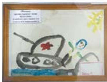
Рисунок первоклассника Ивана Крутого.

(29 июля), и фамилия. Крутой – русифицированная версия от Крутий.