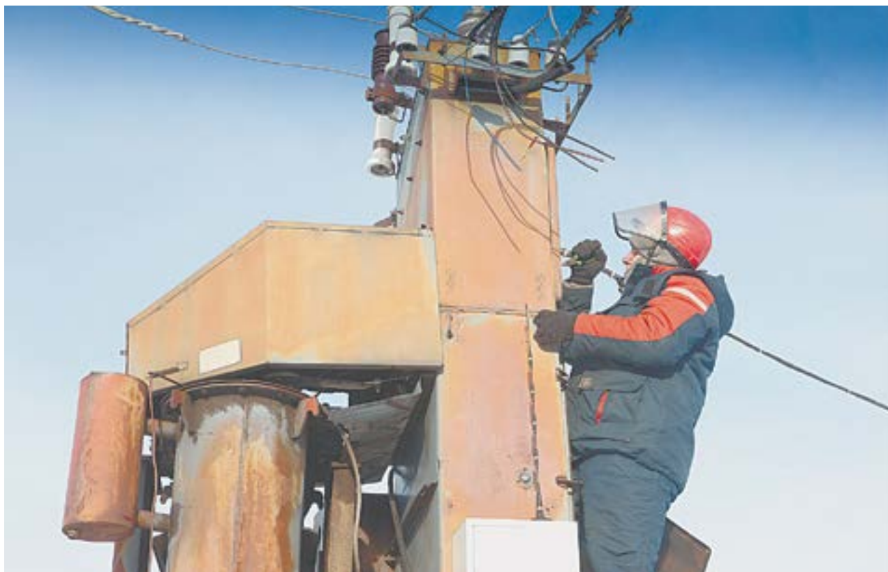
Иногда приходится обслуживать объекты на чужих участках.