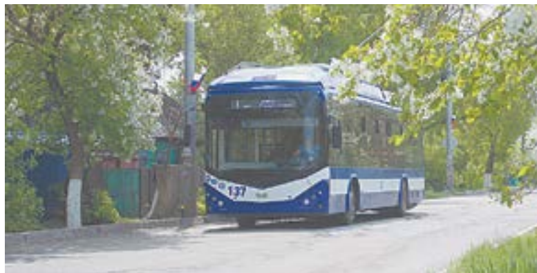
Рубцовск получил новые троллейбусы.

Кроме того, наше предприятие несет социальную нагрузку, обе-