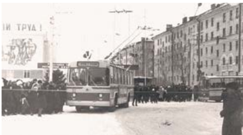
Начало троллейбусного движения в городе.