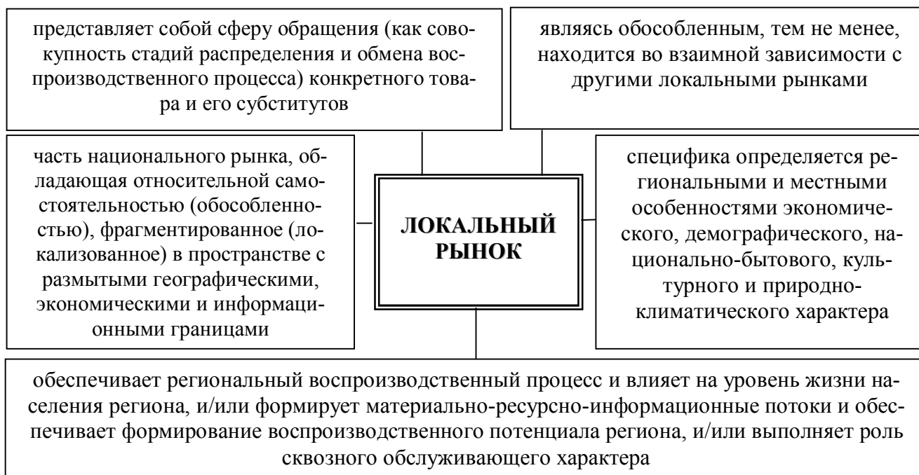
Рис. 1 – Критериальные черты локального рынка