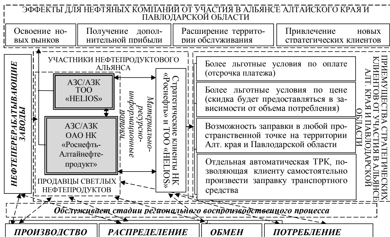
Рис. 5 – Модель нефтепродуктового альянса Алтайского края

ентов качественным топливом на всех маршрутах движения Павлодарской области и Алтайского края, др.