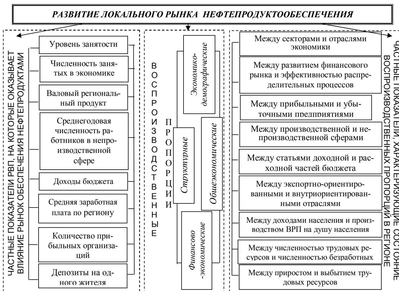
Рис. 3 – Авторское представление о влиянии локального рынка нефтепродуктообеспечения на воспроизводственные пропорции региона

посредством участия в формировании частных показателей состояния воспроизводственных пропорций, отражено на рис. 3. Это позволяет определить данный локальный рынок в качестве объекта изучения в контексте проблемы исследования.