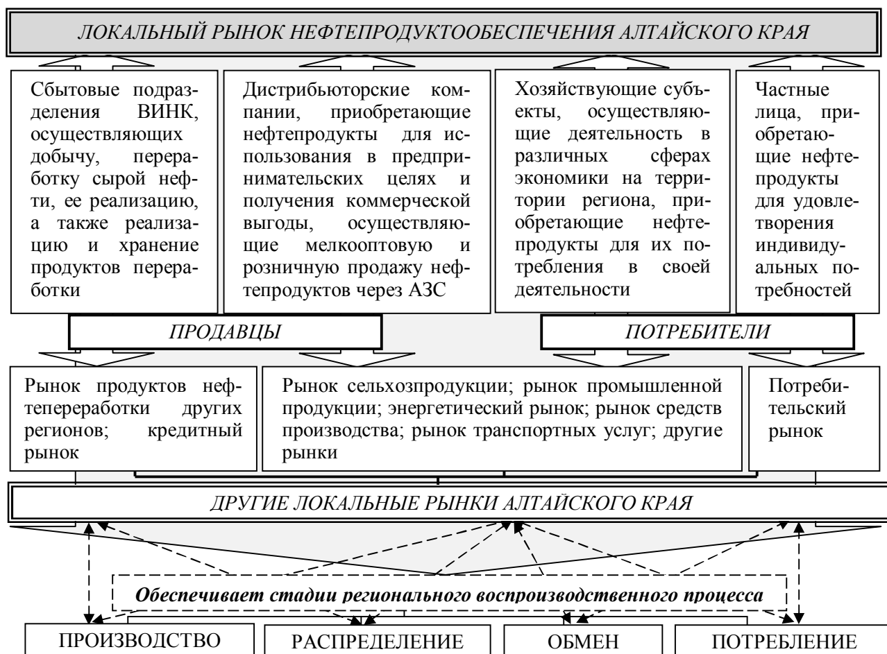
Рис. 4 – Взаимодействие локального рынка нефтепродуктообеспечения с другими локальными рынками и его участие в обслуживании стадий регионального воспроизводственного процесса

тепродуктов в край осуществляется в основном с нефтеперерабатывающих заводов Сибири – Ачинского НПЗ (основной оператор-поставщик – ОАО «НК «Роснефть»-Алтайнефтепродукт») – 28% в объемах поставок, Омского НПЗ (основной оператор-поставщик – ОАО «Газпромнефть – Новосибирск»), Ангарской нефтехимической компании, Павлодарского НПЗ (Казахстан), Яйского НПЗ, мини НПЗ Новосибирской области. В крае функционируют 11 крупных нефтебаз, расположенных в Алейском, Бийском, Благовещенском, Завьяловском, Заринском, Каменском, Кулундинском, Повалихинском, Поспелихинском, Рубцовском и Топчихинском районах.