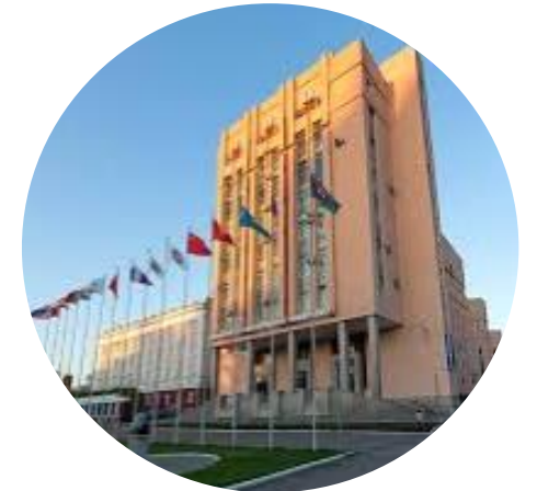
Алтайский государственный университет, пр-т Ленина, 61

+7(3852)638-221 +79133637447 vyssotskaya_olga@mail.ru