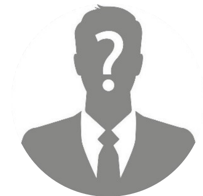
Список менторов уточняется