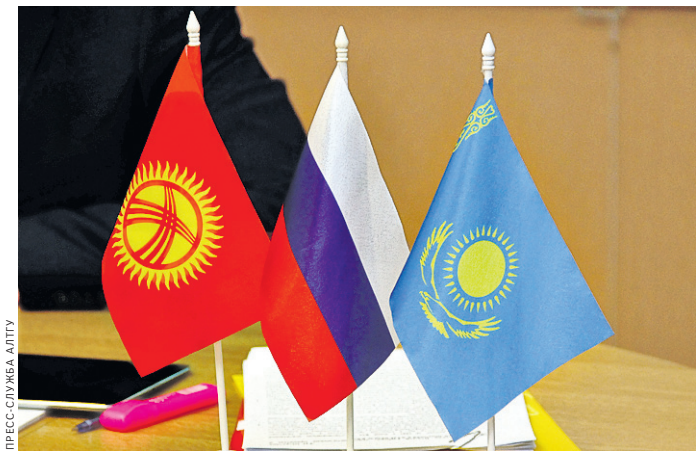
Тема тюрко-славянского единства столетиями не теряет актуальности.

Россия) главным достижением взаимодействия тюрков и славян в разные исторические периоды считает создание мультикультурных государств.