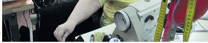
Работники социальной швейной мастерской могут трудиться не только в цехе, но и на дому.

Интерес социальных предпринимателей к легкой промышленности растет. Пятнадцать процентов выпускников школы ЦИСС-2020 посвятили свои проекты этому направлению и наладили производство одежды, обуви, галантерейных изделий, предметов быта.