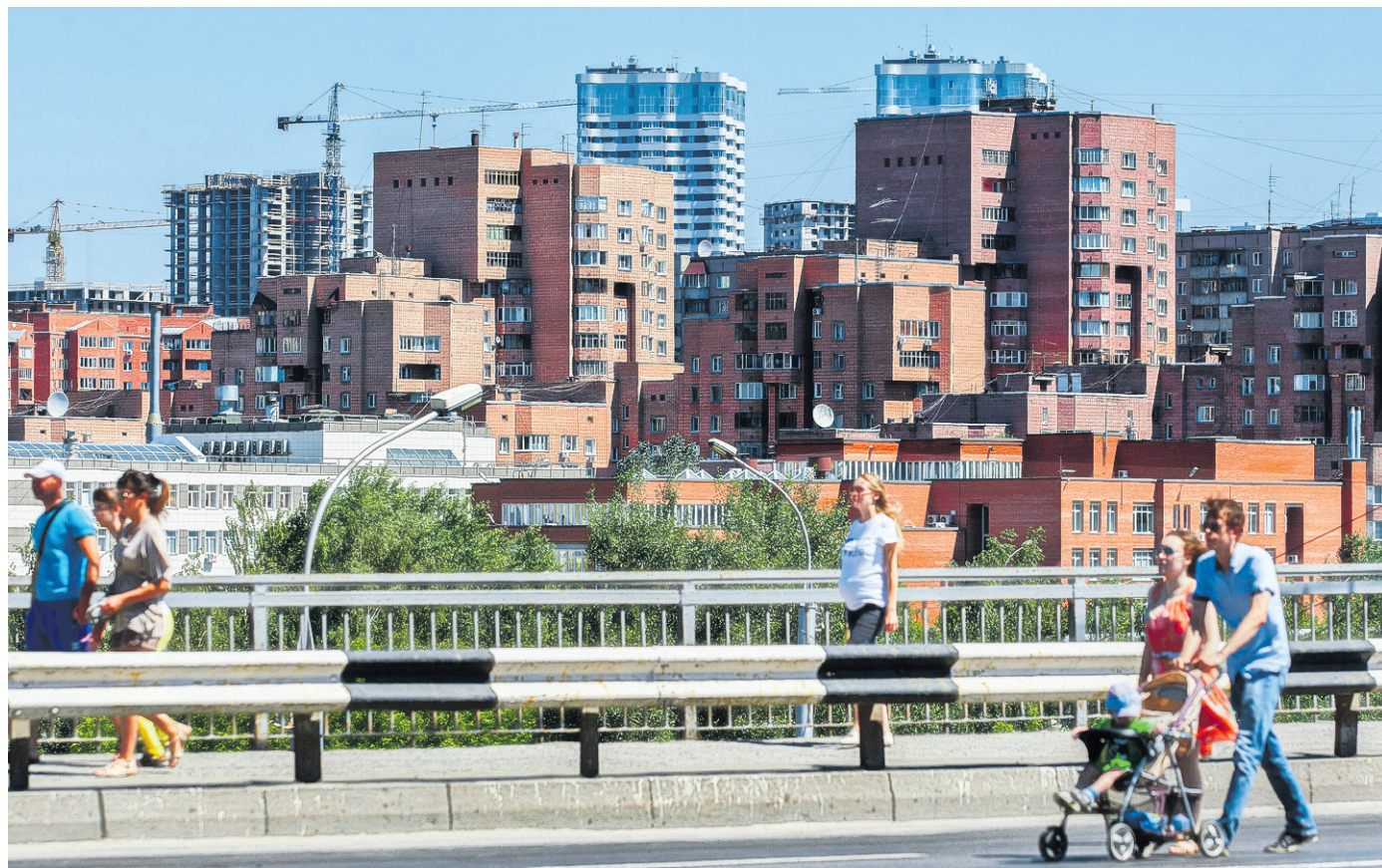
Более полумиллиона квадратных метров жилья сдали в Новосибирске в первом полугодии 2021-го. Как сообщили в мэрии, это на 30 процентов больше, чем за аналогичный период 2020 года.