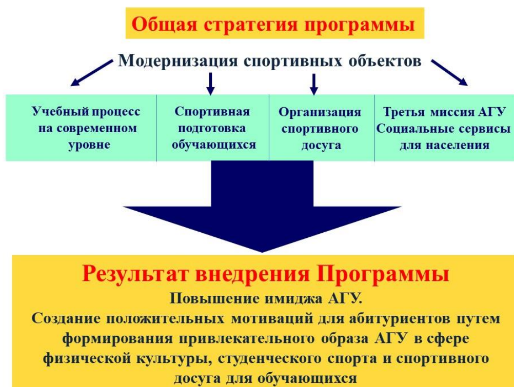
Рис. 3 Общая стратегия Программы

Результатом внедрения программы является поднятие имиджа АлтГУ и создание положительных мотиваций для абитуриентов путем формирования привлекательного образа АлтГУ в сфере физической культуры, студенческого спорта и спортивного досуга для обучающихся.