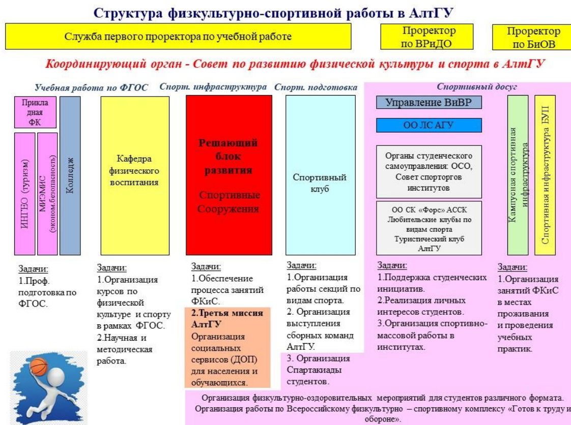
Рис. 2 Структура физкультурно-спортивной работы в АлтГУ

Базовым элементом программы принимается ресурсное обеспечение физической культуры и спорта и развитие спортивной материально-технической базы, что определяет направления и возможности дальнейшего развития ФКиС в АлтГУ.