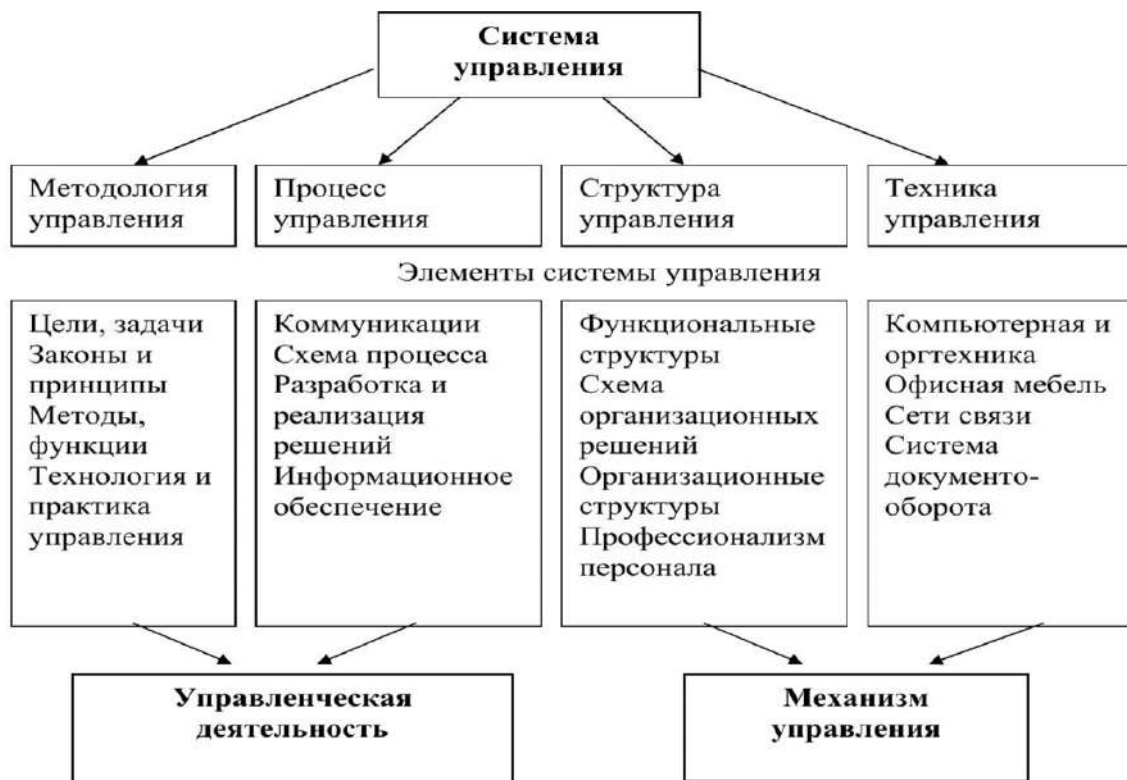
Рисунок 1.2. - Основные элементы системы управления организацией

После названия рисунка следует пропустить одну пустую строку и продолжить текст работы.